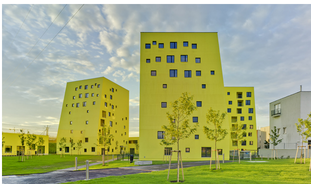
Von der Idee bis zur Umsetzungen! Play Studio - Fallow Land

EUROPAN initiiert Pilotprojekte mit einem spezifisch angelegten Prozessdesign, das wegweisende Strategien der Qualitätssicherung aufzeigt. Mit einem von der Vorbereitung bis zur Umsetzung kompetent und engagiert abgewickelten Gesamtprozess etablieren sich die Standortpartner*innen EUROPANs als maßgebende Akteur*innen im Kompetenznetzwerk der europäischen Planungskultur.