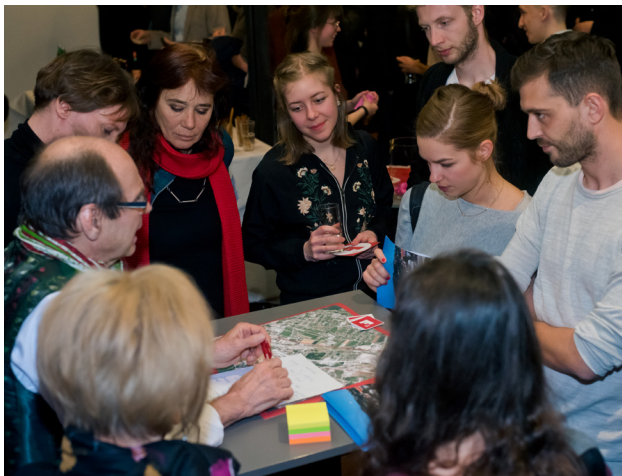
Spannende Diskussionsforen, Vernetzung & Wissensaustausch