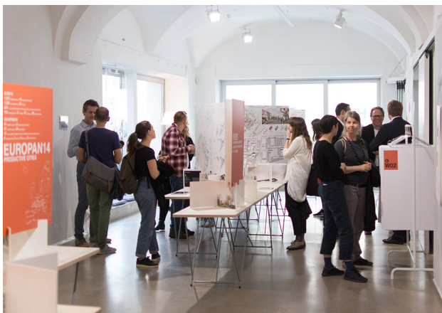
Ausstellung der Siegerprojekte an den Standorten

ALL-INCLUSIVE-PAKET: Gesamtorganisation, Moderation, Preisgelder, Ausstellung, Kongresse, Publikationen, Workshops für 90.000,- . Dank bestehender Fördermittel vom Bund erhalten EUROPANs Standortpartner*innen das EUROPAN Gesamtpaket zu einem außerordentlich günstigen Preis: Der auf drei Jahre aufgeteilte Finanzierungsbeitrag kann auch von mehreren Partner*innen finanziert werden.